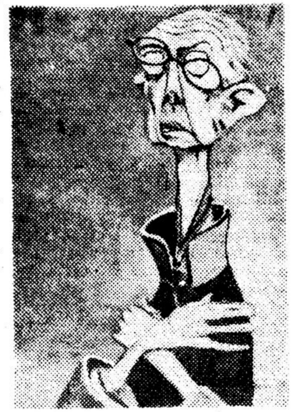
К. П. Победоносцев. Карикатура из альбома „Пертритов галерея градоначальников...“