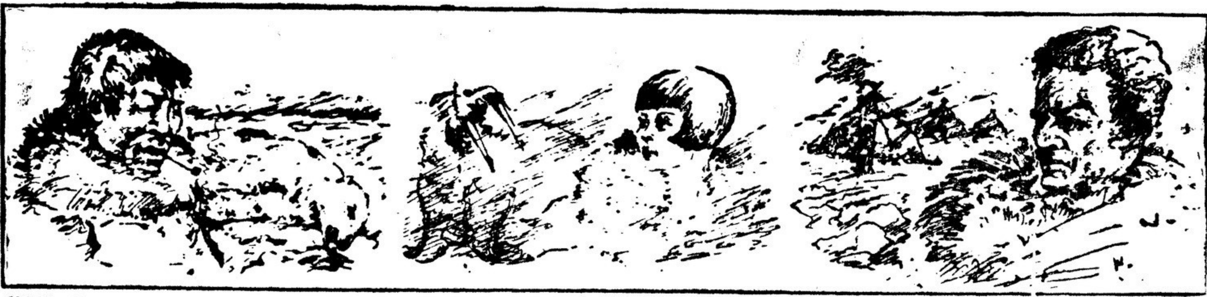
В ГОСЛИТИЗДАТЕ ВЫХОДИТ ПЬЕСА В СТИХАХ И. СЕЛВИНСКОГО «УМКА — БЕЛЫЙ МЕДВЕДЬ» С ИЛЛЮСТРАЦИЯМИ ХУДОЖНИКА Б. РЫБЧЕНКОВА. СЛЕВА НАПРАВО: УМКА, НИНА И КАВАЛЕРИДЖЕ.