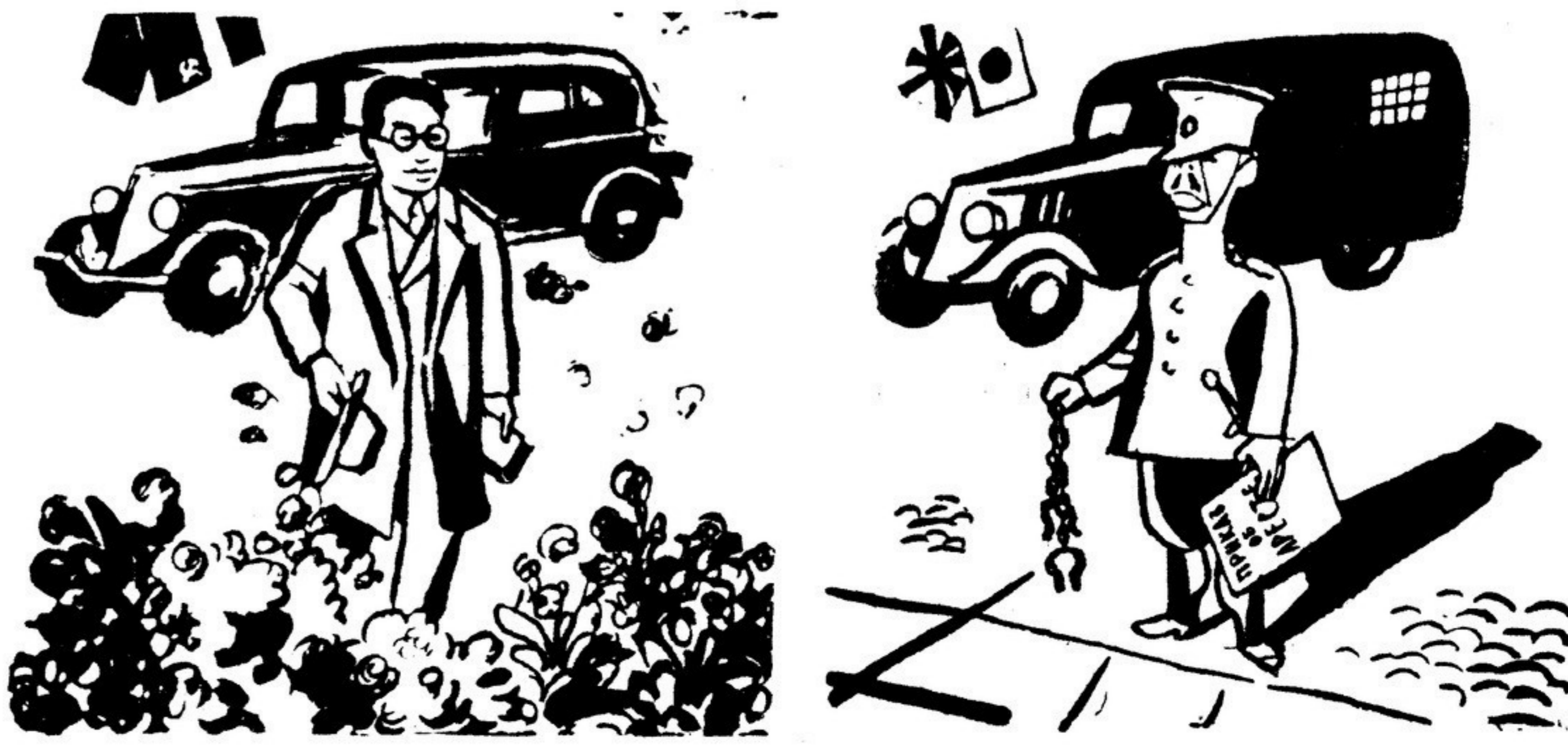
ТАК ВСТРЕЧАЛИ Т. ХИДЗИКАТА В СССР

За выезд в СССР и выступление на с'езде писателей исключены из состава явров японский деятель искусства и литературы т. Хидзиката. По возвращении в Японию ему обещан арест.